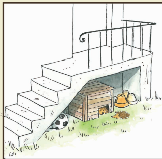
Dessins : © Ivan Thienpont