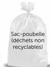
Sac-poubelle (déchets non recyclables)